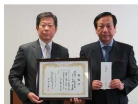
寄付金贈呈(社会福祉協議会)