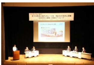
事故防止セミナー

また、国土交通省近畿運輸局（以下「近畿運輸局」という。）主催の事故防止セミナー、運輸安全マネジメントシンポジウム（バス）等の開催に協力した。