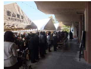
合同慰霊祭(霊前観音)

運輸関係業務に従事して物故された方々の御霊をお慰めするため、合同慰霊祭を平成29年11月6日に京都東山霊山観音において執り行った。