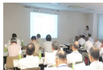
サロンセミナー(会議室)

近畿陸運OB会と連携して、会員向けシニアサポート事業である「サロン・セミナー」を3回開催し、支援に努めた。