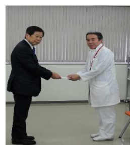
車椅子贈呈(兵庫県)

ロ 交通事故に被災し治療に励まれている方々を支援するため、兵庫県下13病院に車椅子を13台寄贈した。