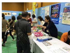
わかやま商工まつり

イ 以下の各地域のイベント開催時に、イメージキャラクター「サード君」を活用してナンバープレート・自動車盗難予防意識の向上を図るための広報・啓発を行った。