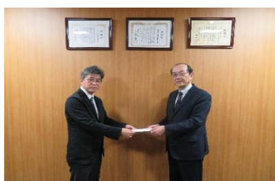
寄付金贈呈（交通遺児等育成基金）