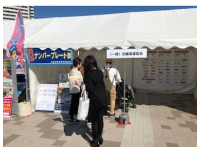
兵庫カーライフ・フェスタ