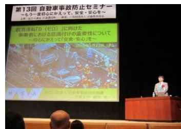
事故防止セミナー

また、国土交通省近畿運輸局（以下「近畿運輸局」という。）主催の事故防止セミナー、運輸安全マネジメントシンポジウム「安全管理体制