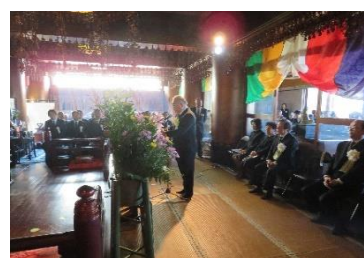
合同慰霊祭（霊前観音）

運輸関係業務に従事して物故された方々の御霊をお慰めするため、合同慰霊祭を令和元年11月5日に京都東山霊山観音において執り行った。