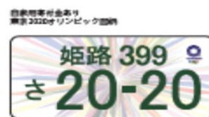
オリ・パラ特別仕様ナンバープレート

ロ 東京2020オリンピック・パラリンピック競技大会特別仕様ナンバープレート(以下「特別仕様ナンバープレート」という。)の円滑な交付業務の遂行に努めた。(令和3年9月末で申込終了)