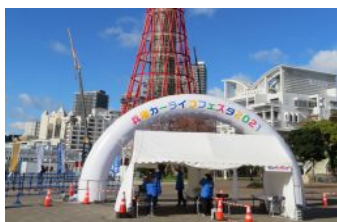
兵庫カーライフ・フェスタ

イ 地域のイベント開催時に、イメージキャラクター「サード君」を活用してナンバープレート・自動車盗難予防意識の向上を図るための広報・啓発を行った。