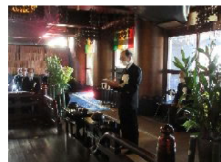
合同慰霊祭(霊山観音)

運輸関係業務に従事して物故された方々の御霊をお慰めするため、合同慰霊祭を令和3年11月5日に京都東山霊山観音において規模を縮小して執り行った。