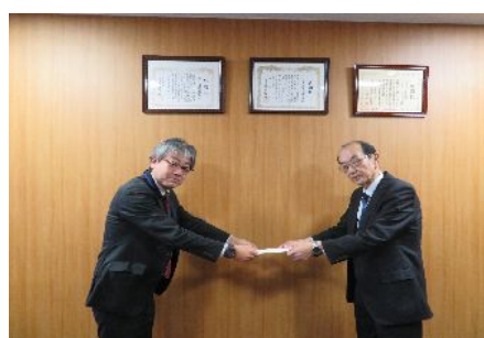
寄付金贈呈（交通遺児等育成基金）